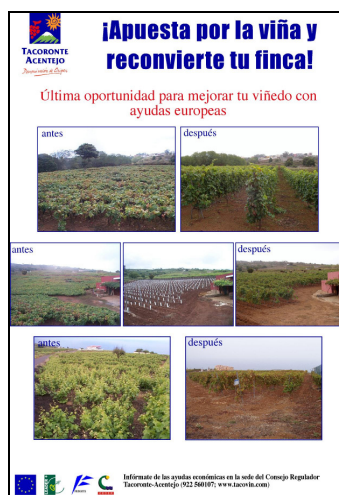
Figura 2. Díptico "Moderniza tu viñedo"