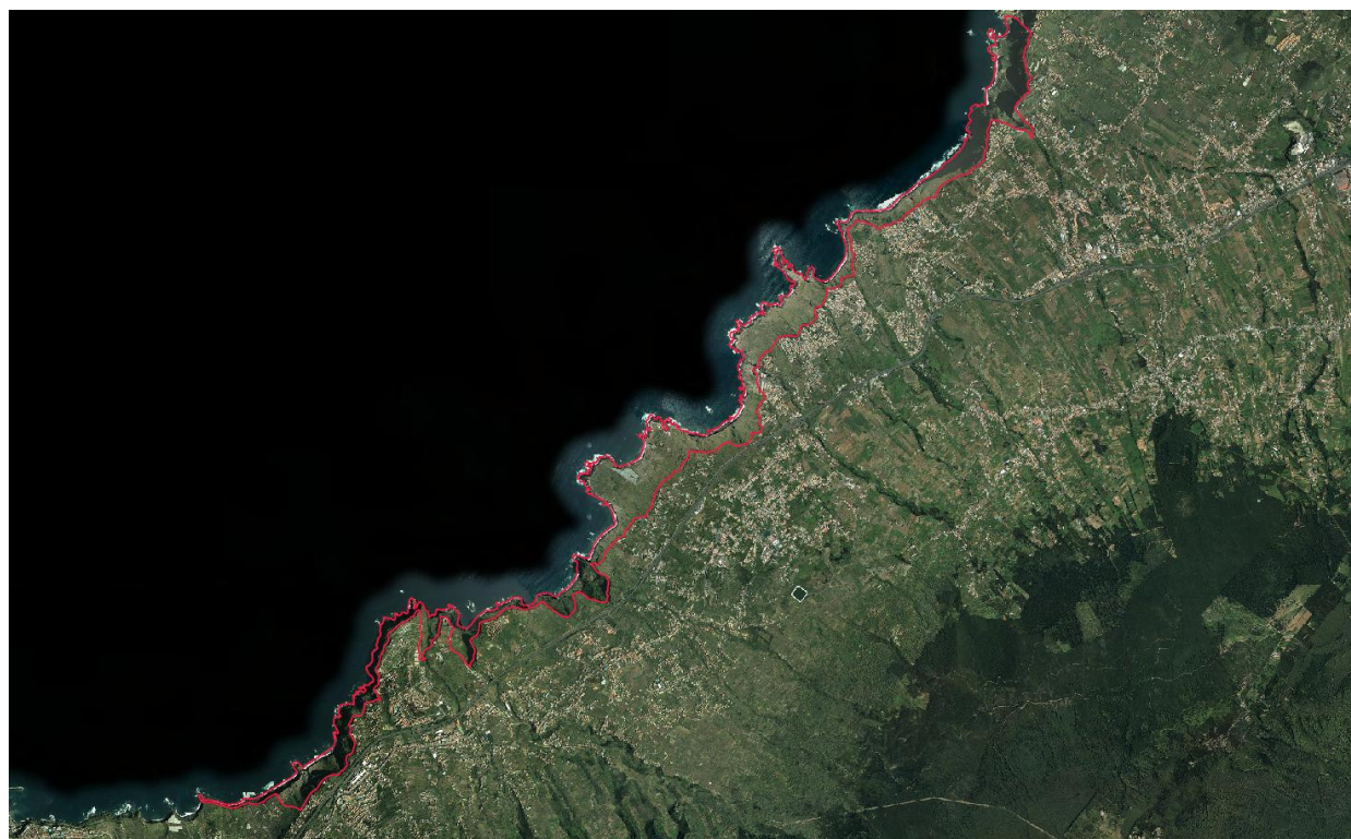
Ámbito territorial del Paisaje Protegido de la Costa de Acentejo

Gran parte del Paisaje es una zona acantilada y abrupta, con varios barrancos que rompen la línea de los acantilados y se abren al mar. Existen pocas áreas de pendiente moderada, entre las que destacan las plataformas costeras de Playa de la Arena, Rojas, El Caletón y Punta del Sol. La actividad agrícola escasea, con un abandono prolongado y sólo dos áreas cultivadas (en Punta del Sol y en El Rincón).