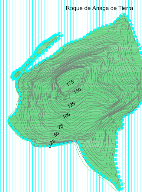
Roque de Anaga de Tierra