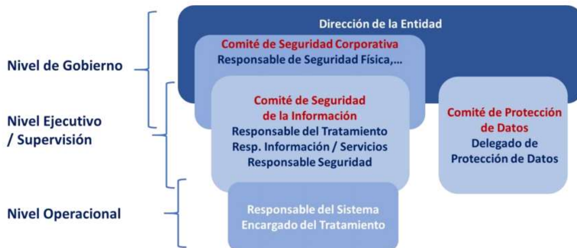
Figura 1. Niveles de la estructura de seguridad

Partiendo de estos bloques de responsabilidad, esta guía propone un modelo de referencia basado en tres niveles : Nivel de Gobierno , Nivel Ejecutivo y Supervisión y Nivel Operacional (ver figura 1).