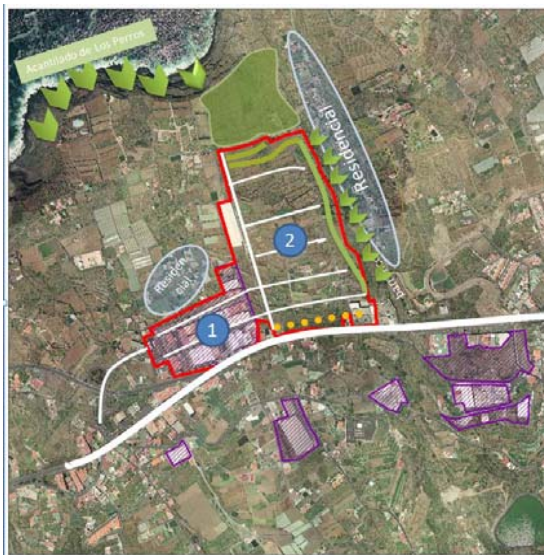
Ortofotografía Polígonos comarcales potenciales Áreas industriales inventariadas