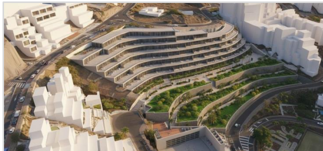
Figura 5. Resultado orientativo del conjunto

La figura 5 muestra el resultado final tras aplicar los cambios introducidos en el PAMU. La imagen tiene carácter orientativo.