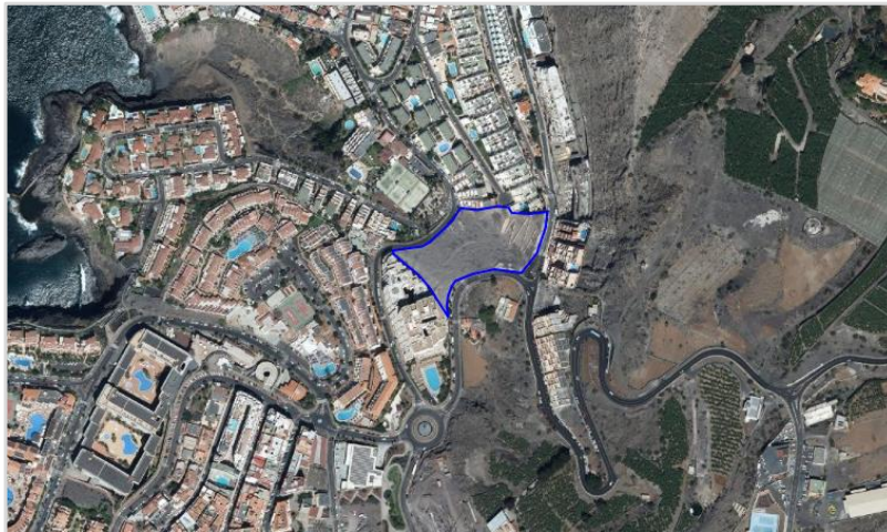
Figura 1. Delimitación del ámbito territorial objeto del PAMU.

El entorno circundante está fuertemente antropizado y edificado, como se aprecia en la figura 1. La topografía ha condicionado sobremanera el desarrollo urbanístico, de forma que la tipología edificatoria predominante es la edificación de varias plantas de altura, con disposición escalonada o aterrazada para adaptarse a la pendiente, factor que también ha condicionado el trazado del viario local y que influye de forma relevante en la propuesta contenida en el PAMU, ya que el ámbito de intervención se sitúa entre las cotas 48 y 95 m de altitud, con una pendiente del 46%. Éste se encuentra inserto en la manzana que conforman las calles Hibisco y Petunia (al oeste), y las avenidas Quinto Centenario (al sur) y José González Forte (al este y norte). Además, se conecta de manera transversal con una calle de servicio sin salida (calle Flamboyant).