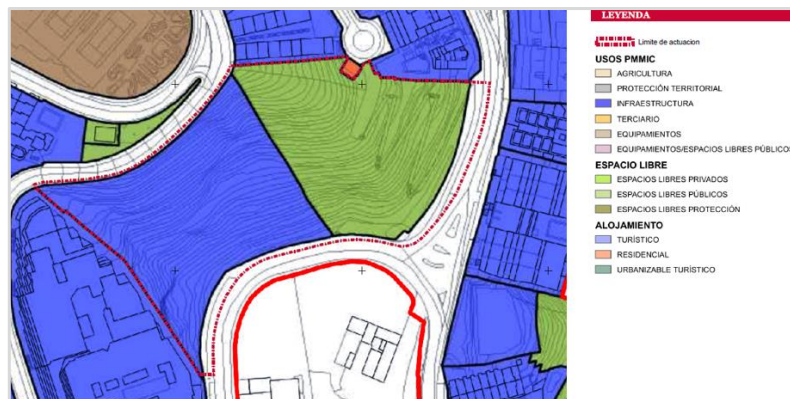
Figura 3. Ordenación del ámbito de intervención (asignación de usos). PMMIC

El PMMIC destina la parcela de uso residencial referida en este apartado al uso turístico, pero no prevé intervenciones privadas en ella, por lo que se mantienen los parámetros urbanísticos establecidos en las NN.SS. En cuanto al espacio libre, el PMMIC sí contempla dos actuaciones de carácter público: EL_02 y MI_02 que corresponden con el sistema de espacios libres y con el sistema de miradores respectivamente.