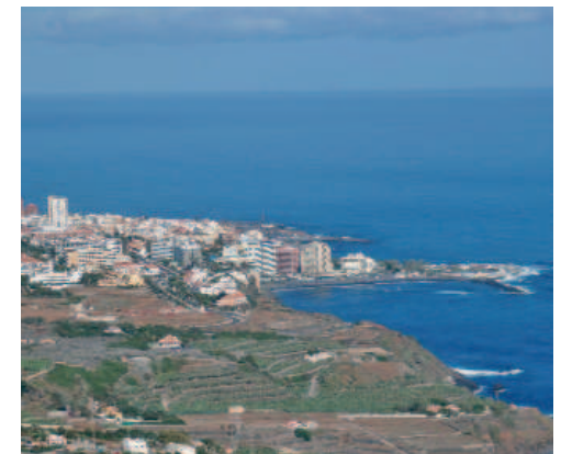
Vista del Puerto de La Cruz