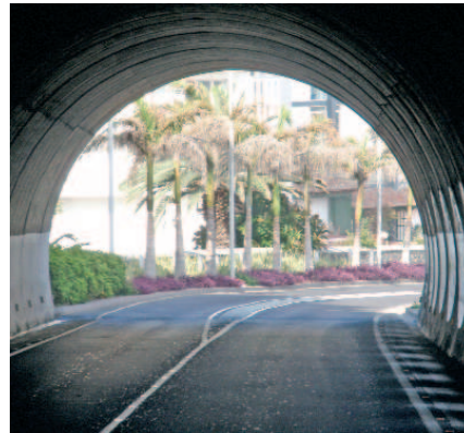
Entrada al Puerto de la Cruz

El túnel se sitúa en un acantilado costero denominado "Ladera de Martiánez",