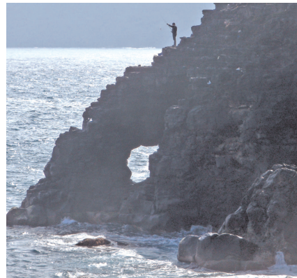
Pesca de risco desde el acantilado

El túnel se sitúa en un acantilado costero denominado "Ladera de Martiánez",