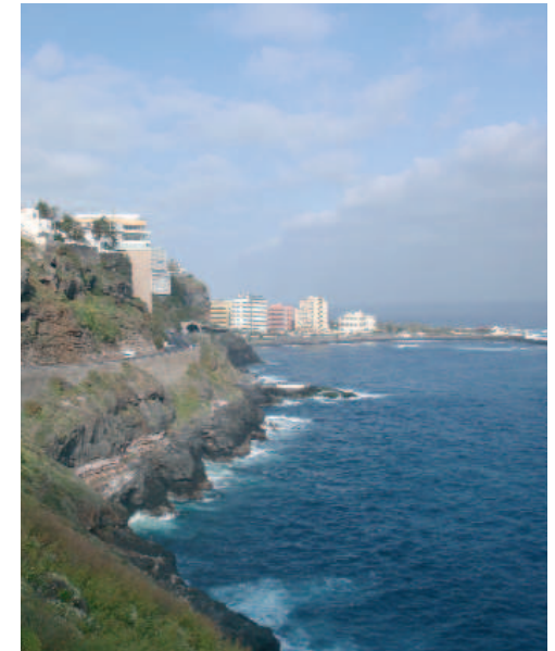
Panorámica de la carretera bordeando la costa

En el último kilómetro, la carretera prácticamente bordea el acantilado, atravesando un túnel panorámico de 300 metros de longitud desde donde se divisa el lago Martiánez, complejo de ocio compuesto por piscinas y lagos artificiales, diseño del artista lanzaroteño César Manrique, en cuyo subsuelo se encuentra el Casino Taoro.