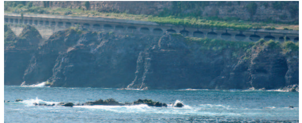
Falso Túnel en la Ladera de Martiánez

espacio de elevado interés botánico, pues conserva restos de una vegetación relictica de carácter termófilo, y sobre todo de gran relevancia arqueológica, pues sus cuevas debieron consti-