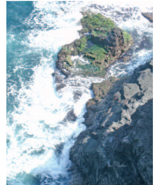
Detalle del oleaje rompiendo en las rocas

A la salida del túnel entramos en el casco urbano del Puerto de la Cruz, dejando a la derecha la playa de Martiánez. El territorio que ocupa actualmente esta ciudad fue ganado al mar en dos fases volcánicas: sobre el antiguo cantil, fruto de antiguas coladas, una nueva erupción vierte su lava modificando el litoral profundamente, dando lugar a una nueva plataforma lávica costera sobre la que se asienta el actual casco urbano de la ciudad.