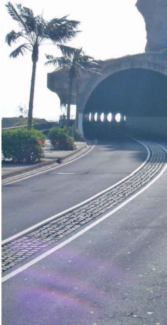
Obra de fábrica ubicada a la entrada del Puerto de la Cruz