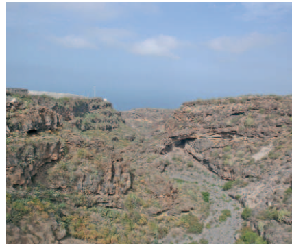
Barranco de Erques

A través del recorrido por esta carretera, también podemos ser testigo de otro de los potenciales económicos de