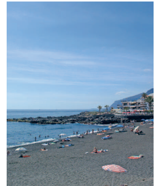
Playa La Arena

Al final de la carretera puede optar por desviarse a la izquierda hacia el núcleo turístico de los Acantilados de los Gigantes, con sus precipicios marinos de hasta 600 metros de altura, o bien dirigirse a la derecha, hacia el Parque Rural de Teno, macizo montañoso de gran valor paisajístico, ecológico y antropológico donde se pueden apreciar las particularidades agrícolas de la isla, su arquitectura tradicional, así como su riqueza florística y faunística.