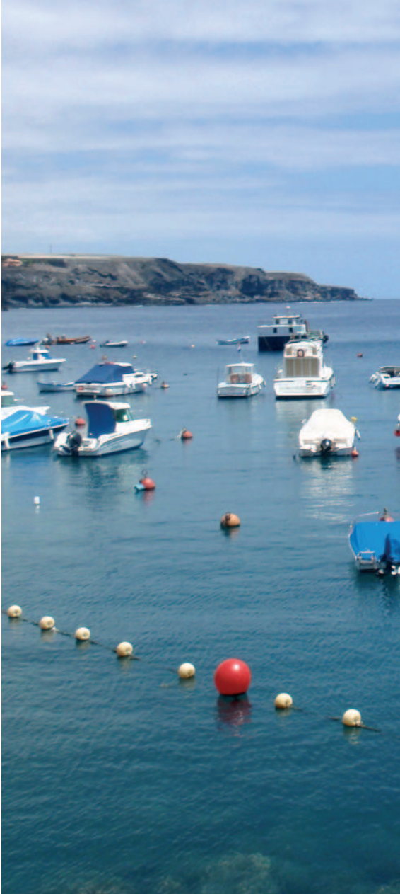
Playa de San Juan