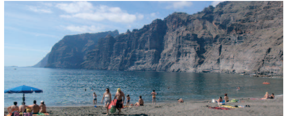
Playa de Los Gigantes

la isla: la acuicultura marina. La presencia de jaulas flotantes dedicadas al cultivo de dorada y lubina, nos hablan de