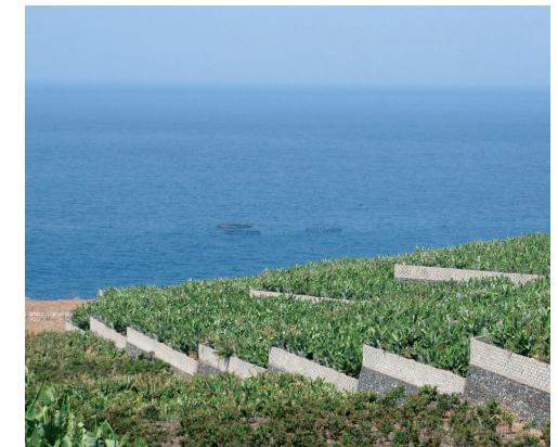
Monocultivo de plátano