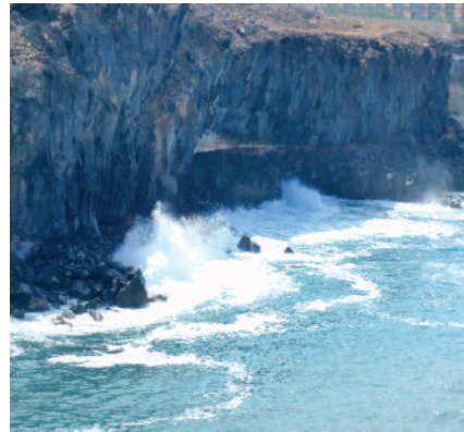
Acantilado de Isorana

acogen también 12 endemismos de la flora canaria.