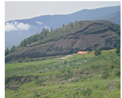
Cráter de Media Montaña