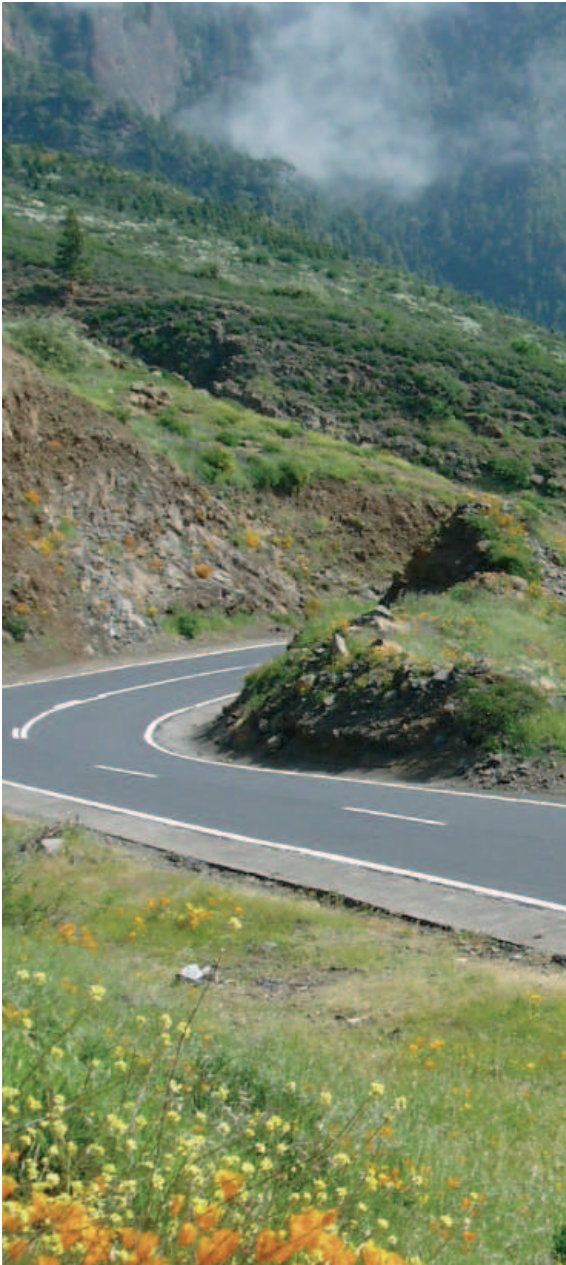
Vista de la zona de Chivisaya