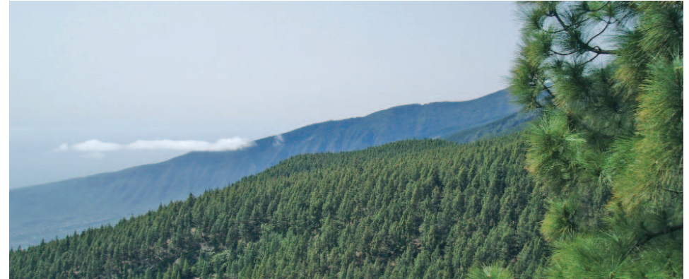
Espacio Natural Protegido de Corona Forestal

y Arafo, así como el Paisaje Protegido de Siete Lomas. Pero quizás lo más impre-