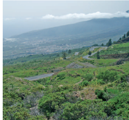
Panorámica del mirador de Chivisaya