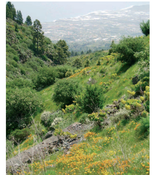
Bosque de pinar seco

A partir de esta zona nos adentramos en una importante y densa población de pinar que abarca varios kilómetros, el Espacio Natural Protegido de Corona Forestal, paraje que podemos disfrutar desde el mirador de la Montaña Roja, apreciando el curioso efecto del mar de nubes, acompañados por el canto del pinzón azul o el pájaro picapinos.