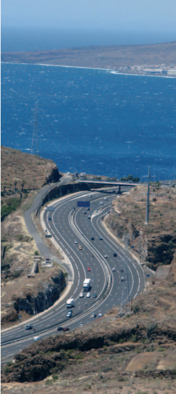
Integración paisajística de la TF-1 en Barranco Hondo

ras destinadas a la obtención de energías renovables: las placas solares y los aéreo-generadores, para la producción de energía solar y eólica, respectivamente.