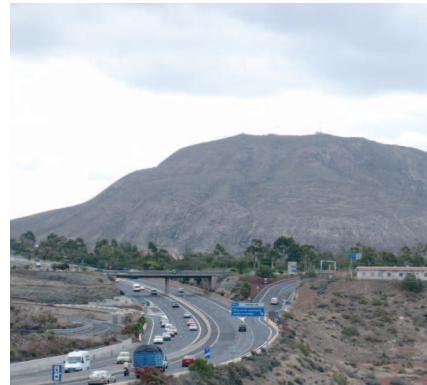
Vista de Montaña de Guaza

ras destinadas a la obtención de energías renovables: las placas solares y los aéreo-generadores, para la producción de energía solar y eólica, respectivamente.