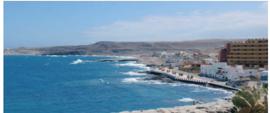
Panorámica de El Porís

La autopista TF-1 sigue su trayecto y en el kilómetro 59 se encuentra el enlace de acceso al Aeropuerto Reina Sofía. El