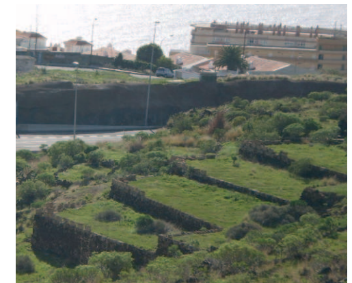
Abancalamiento anexo a la TF-1