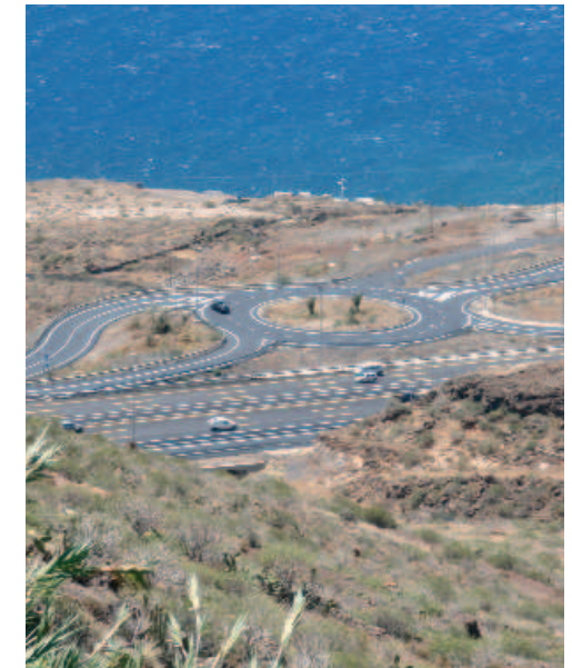
Rotonda de acceso a la TF-1

Más adelante se aprecia, desde la vía, como va cambiando este paisaje sureño y se observan diversas infraestructu-