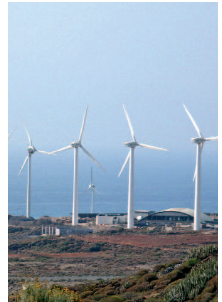
Parque eólico de Granadilla

La TF-1 finaliza su recorrido, tras 80, 8 kilómetros, en Armeñime. En este último tramo de la traza podemos acceder a lugares de gran belleza natural como el Sitio de Interés Científico de la Caleta y la Reserva Natural Especial de Barranco del Infierno, ambos en el municipio de Adeje.