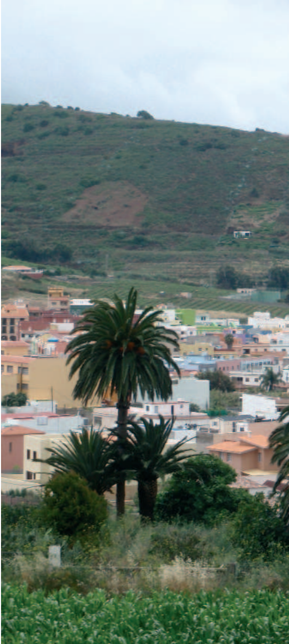
Panorámica del municipio de Tegueste