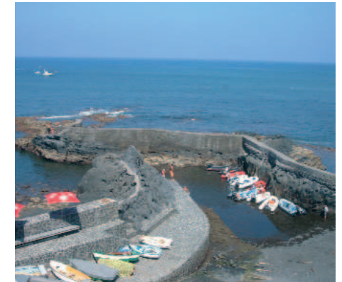
Muelle pesquero de Punta del Hidalgo

Resulta curioso contemplar, a nuestro regreso, el paisaje desde una nueva perspectiva: dejando atrás Punta del Hidalgo, aparece toda la vertiente norte de la isla con el Teide al fondo, estampa que nos estimula a recorrer otros rincones de la isla.