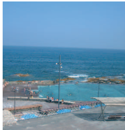
Piscinas naturales de Bajamar

disfrutar de las aguas del Atlántico en su complejo de piscinas naturales. Desde ellas, podemos contemplar la grandeza de las montañas que a escasa distancia delimitan el Macizo de Anaga, donde se conserva la vegeta-