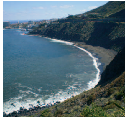
Acanuilados costeros y playa de El Arenal

disfrutar de las aguas del Atlántico en su complejo de piscinas naturales. Desde ellas, podemos contemplar la grandeza de las montañas que a escasa distancia delimitan el Macizo de Anaga, donde se conserva la vegeta-