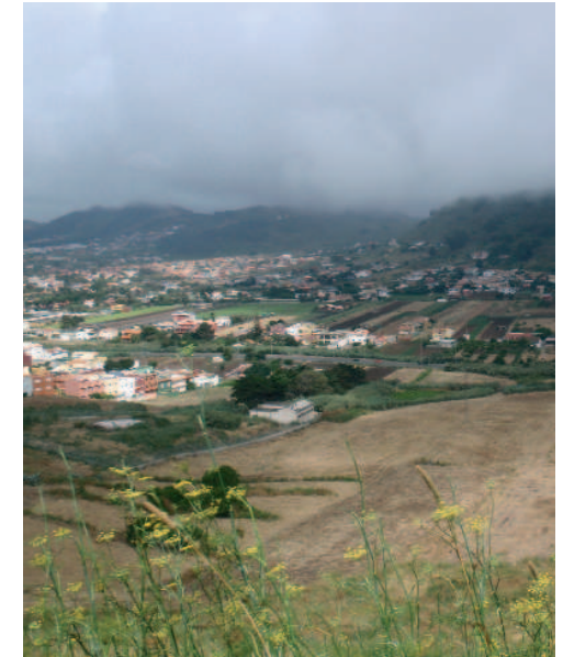
Vista de zona agrícola de El Valle de Aguere

En el kilómetro 15,8 se encuentra la localidad de Bajamar, lugar ideal para