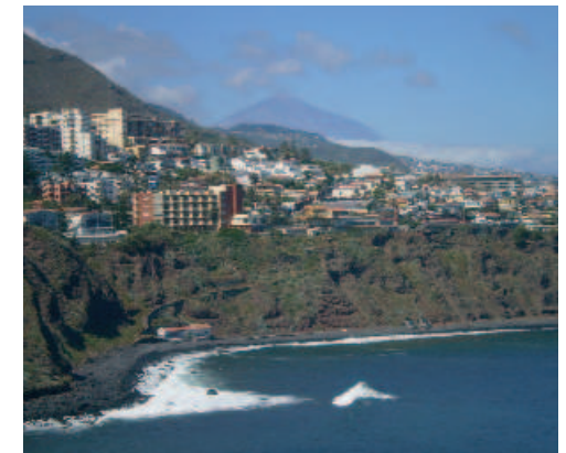
Panorámica de Bajamar con vista del Teide al fondo