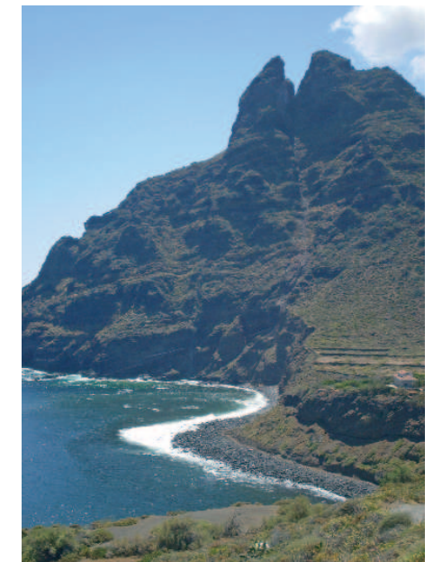
Roque de Dos Hermanos (Punta del Hidalgo)