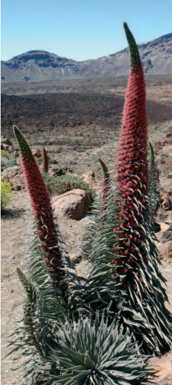
Tajinastes rojos del Teide ( Echium wildpretii )