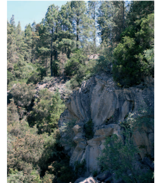
Formación geológica "Margarita de piedra"

Sobre el kilómetro 31,5, a unos 2000 metros de altitud, nos adentramos en el Parque Nacional del Teide, famoso por su magnífica vegetación de alta montaña, en plena floración en los meses de mayo y junio. Al profundizar en el mismo podremos disfrutar de la maravillosa y variada conformación geológica de la isla, teniendo como símbolo principal el edificio volcánico de El Teide.