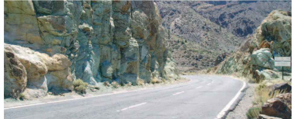
Formación hidrotermal de Los Azulejos

mino municipal de Vilaflor. De manera singular recomendamos la visita del