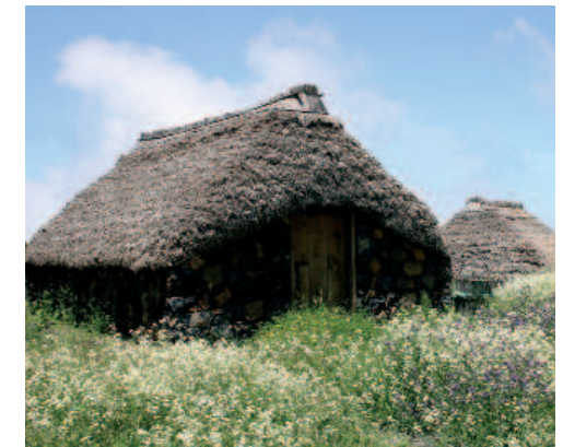
Conjunto de pajares en Aguamansa