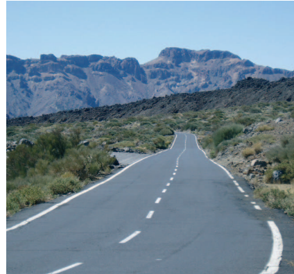
Retamar en el Parque Nacional del Teide

Tampoco podemos olvidar el Llano Ucanca por el que abandonamos el Parque, para más adelante introducirnos en el pinar canario de sur, en el tér-