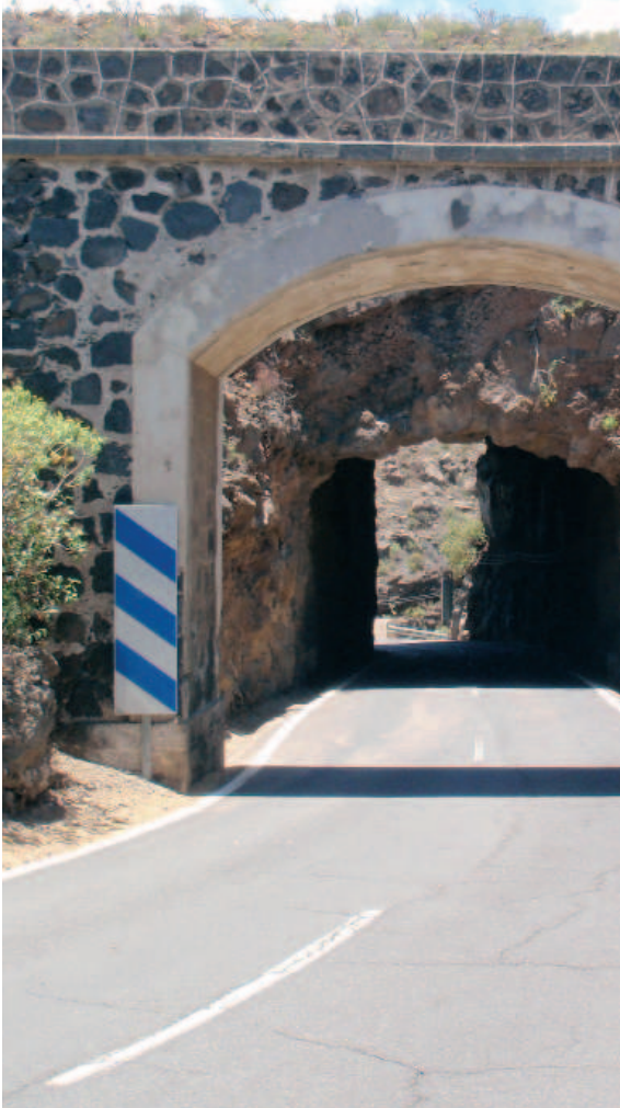
Puente de piedra en Fasnía

sinos, como cuartos de aperos o como fantásticas bodegas.