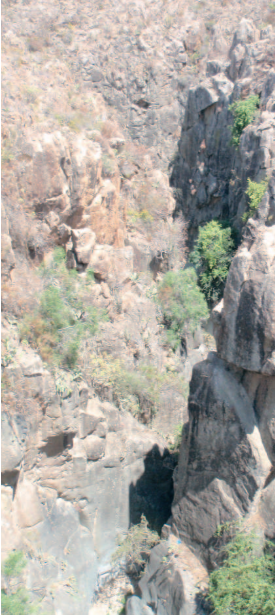
Vista del Barranco de El Río