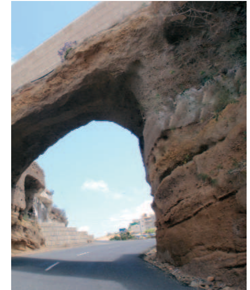
Puentes de piedra (Villa de Arico)

La vegetación dominante es la propia de un cardonal-tabaibal bastante empobrecido por el pastoreo secular y la roturación de estas laderas, en transición