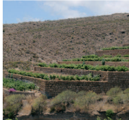
Bancales de jable en cultivo activo

riormente ocupada en parte por los materiales fragmentarios resultantes del