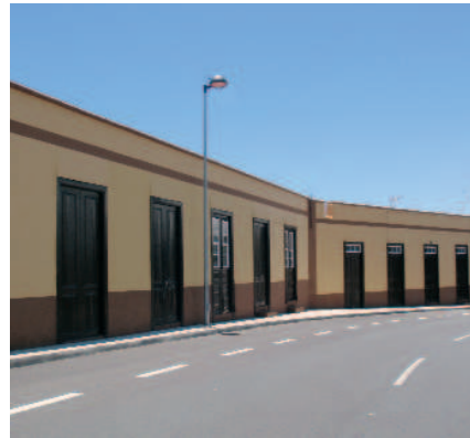
Casas amarillas en Fasnia

hacia formaciones más termófilas, con presencia de alguna palmera ( Phoenix