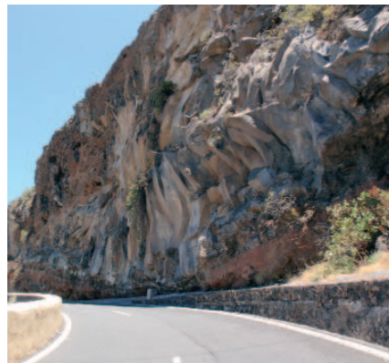
Formación basáltica de Barranco de Herques

hacia formaciones más termófilas, con presencia de alguna palmera ( Phoenix