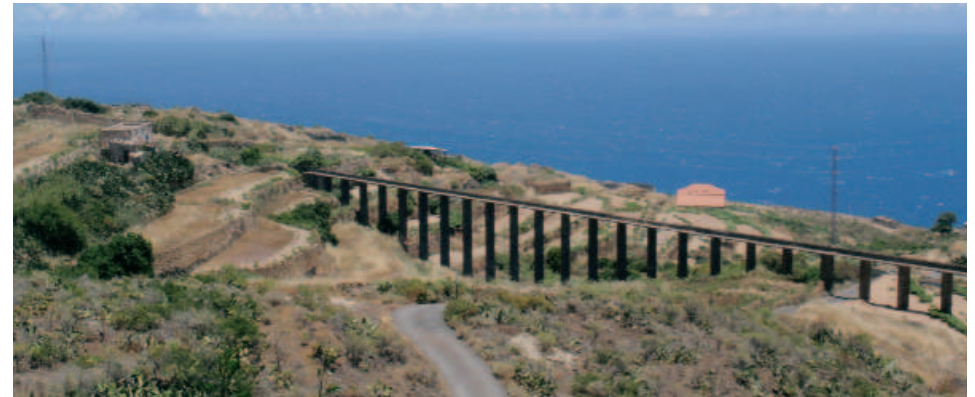
Vista de los canales de conducción de agua llamadas atarjeas

canariensis ), acebuches ( Olea europea ssp. guanchica ), sabinas ( Juniperis turbinata ssp. cerasiformis ), y diversas especies arbustivas: cornicales, vina-