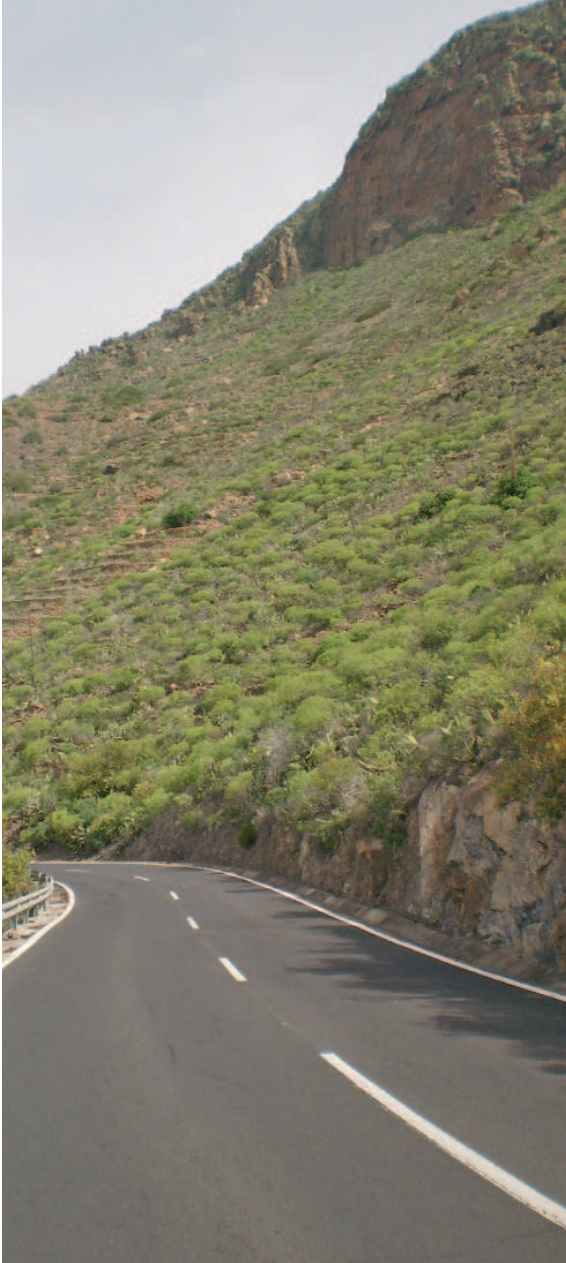
Detalle del Roque de Jama (Valle de San Lorenzo)