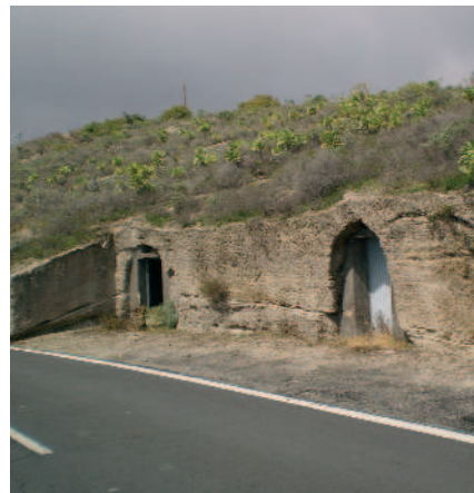
Casas cuevas excavadas en toba o tosca

riormente ocupada en parte por los materiales fragmentarios resultantes del