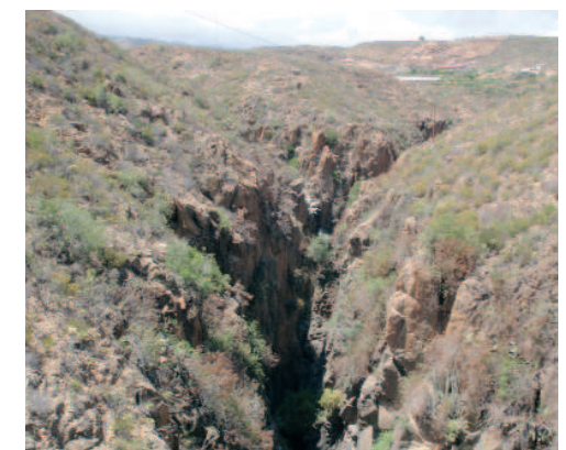
Perspectiva de barranco del sur de la Isla