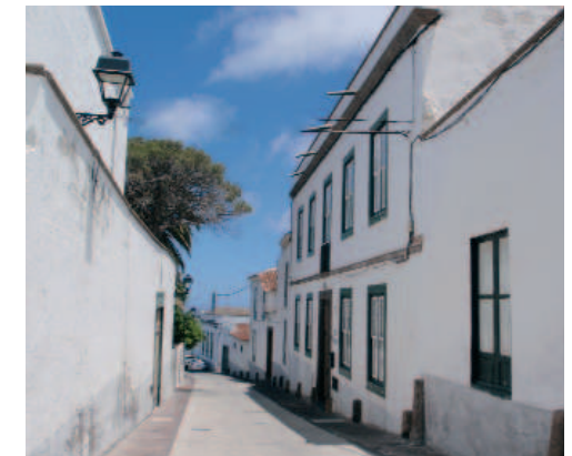
Perspectiva de un caserío en Arico Nuevo