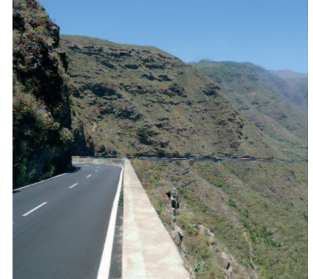
Formaciones sedimentarias en Güímar

Una de las peculiaridades del valle radica en las formaciones sedimentarias en la base de la Ladera de Güímar, constituidas por aluviones de bloques, cantos, gravas y arenas procedentes de la intensa actividad erosiva que caracteriza a los Barrancos de Badajoz y del Agua, que incluso llegan a adquirir espesores superiores a los 20 metros.