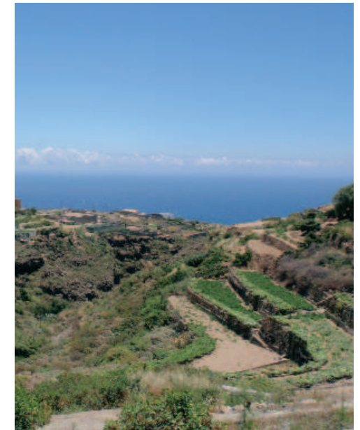
Típicas lomas abancaladas de jable en Fasnia

Termina la carretera en el acceso a la zona turística de Los Cristianos y Las Américas, donde tras un recorrido lleno de curiosidades, podemos disfrutar de un descanso en las playas de la zona.