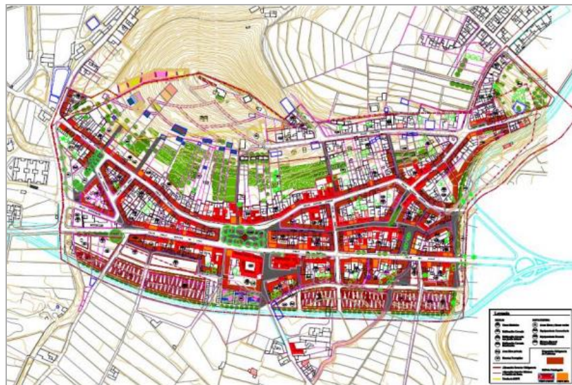
Figura 3. Ordenación propuesta en la alternativa 2 de la Modificación Menor

Supone a criterio del redactor una evidente incompatibilidad con la carretera de circunvalación TF-42, una mayor e intensa ocupación del suelo que excede cualquier estándar, un incremento de la edificabilidad y una menor proporción de zonas verdes.