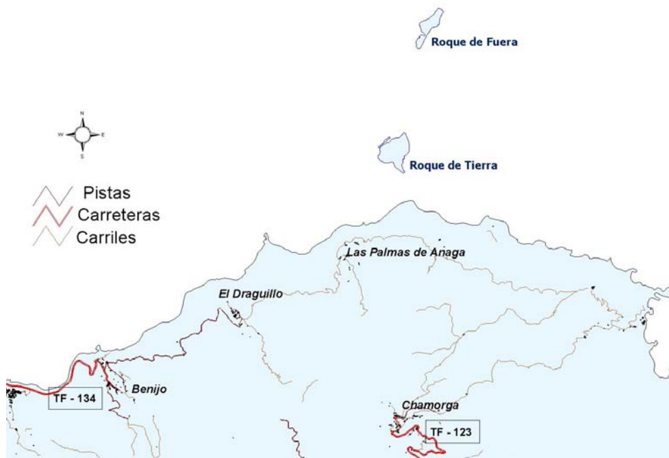
Figura 1 Ubicación y Accesos de la Reserva Natural Integral de Los Roques de Anaga