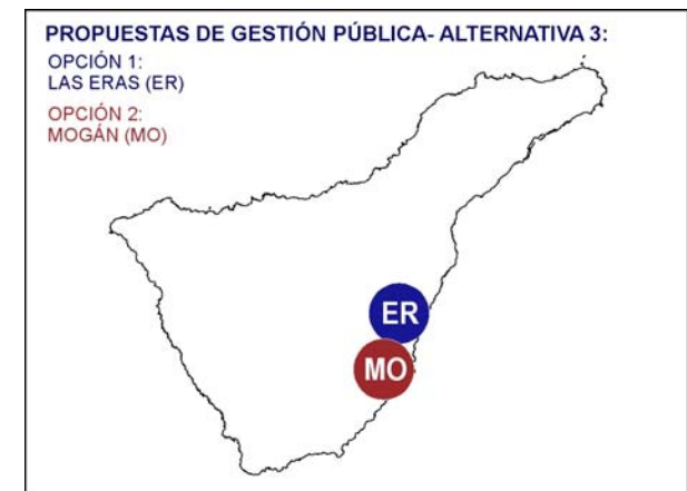
Ilustración 18. Propuesta de gestión pública. Alternativa 3