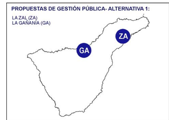
Ilustración 16. Propuesta de gestión pública. Alternativa 1