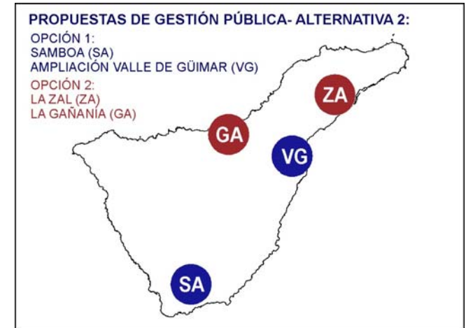
Ilustración 17. Propuesta de gestión pública. Alternativa 2