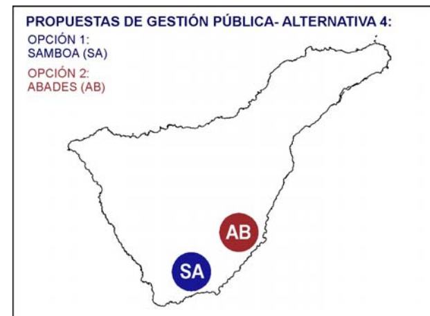
Ilustración 19. Propuesta de gestión pública. Alternativa 4