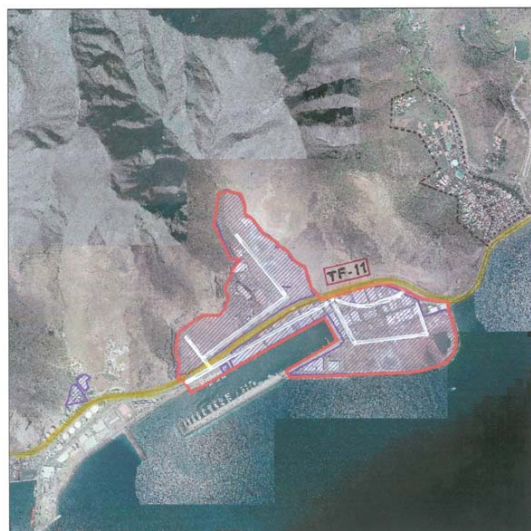
Ortofotografía [Red outline] Polígonos comarcales potenciales [Hatched area] Áreas industriales inventariadas [Dotted line] Usos residenciales