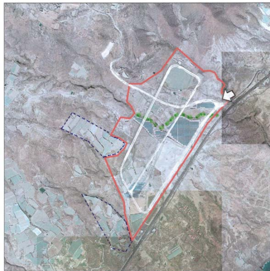
Ortofotografía Polígonos comarcales potenciales Usos agrícolas Áreas industriales inventariadas