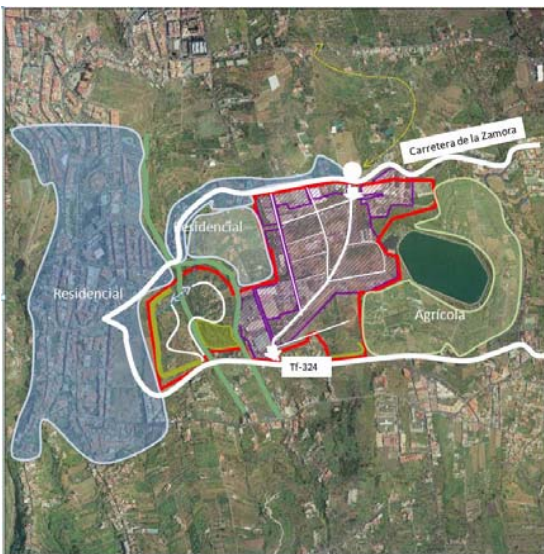
Ortofotografía Polígonos comarcales potenciales Áreas industriales inventariadas