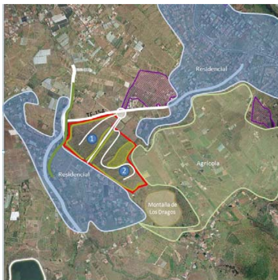
Ortofotografía Polígonos comarcales potenciales Áreas industriales inventariadas