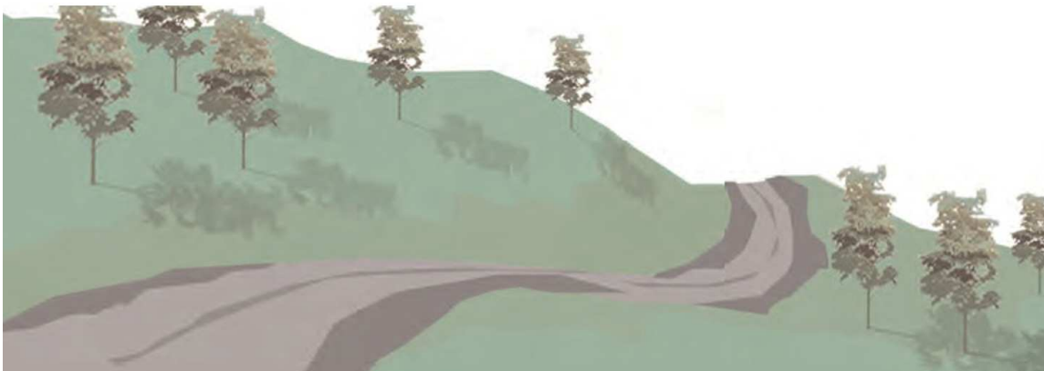
Imagen 2: Ruta más larga, mejor integrada en el paisaje.