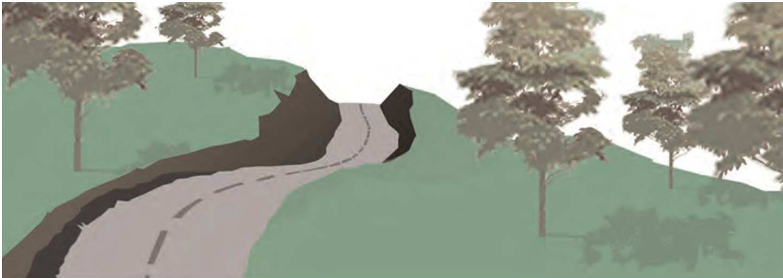
Imagen 1: Ruta más corta pero con mayor movimiento de tierras, mayor impacto.