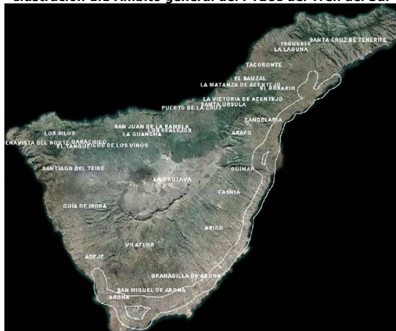
Fuente: Elaboración propia a partir del Visualizador General de Información Geográfica MAPA de GRAFCAN (Cartográfica de Canarias, S.A.). Ortofoto Diciembre de 2006